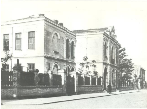
Държавна Девическа Гимназия – Бургасъ

Училище “Константин Фотинов” е създадено през 1879 - 80 г. като Първото класно девическо училище в гр.Бургас, което се трансформира в Девическа пълна гимназия през 1911 – 1912г. В продължение на 130 години то многократно променя профила си, но името на патрона на училището остава непроменен. Това дава основание на всички, които са работили в него да гледат на себе си като на продължители на традицията и историята му.