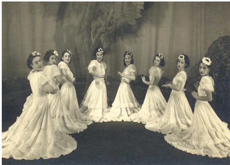
Балетен състав на училище “К.Фотинов”